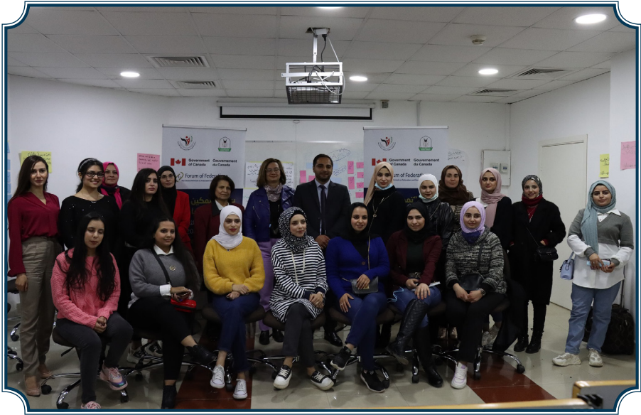
جانب من اختتام البرنامج التدريبي - اعداد التقارير الإعلامية - آذار - 2021

المرحلة الثانية من التدريب تم خلالها تطبيق التدريب عمليا وممارسة تصوير ومونتاج التقارير الإعلامية، التي تم اقتراحها واستخلاصها واعتمادها خلال المرحلة الاولى، حيث تم تقسيم المشاركات الى عدة فرق، لتبدأ عملية اعداد التقارير في الميدان.