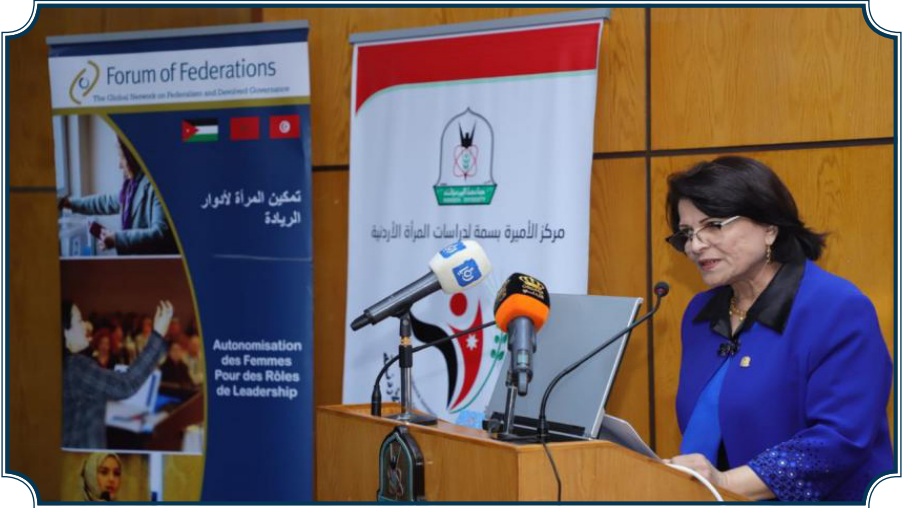
من حفل اختتام مشروع تمكين المرأة لأدوار القيادة 2019-4-15