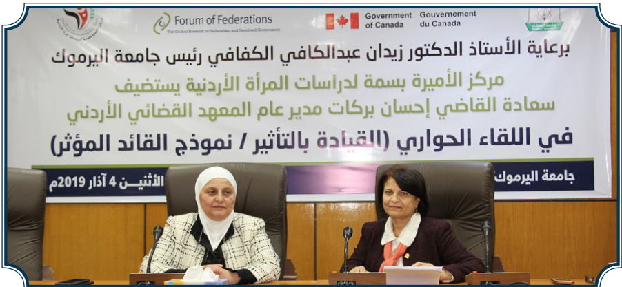
استضافة سعادة القاضي إحسان بركات مديرة المعهد القضائي الأردني 2019/3/4

ومن ضمن فعاليات البرنامج فقد تم استضافة قيادات متميزات، حيث تم استضافة سعادة القاضي إحسان بركات مديرة المعهد القضائي الأردني (حينها) للحديث عن القيادة بالتأثير. وقد حضر اللقاء جميع المشاركات بالبرنامج التدريبي وعدد من أعضاء الهيئة التدريسية بالجامعة، حيث دار حوار موسع أجابت من خلاله سعادة القاضي بركات على أسئلة واستفسار الحضور.