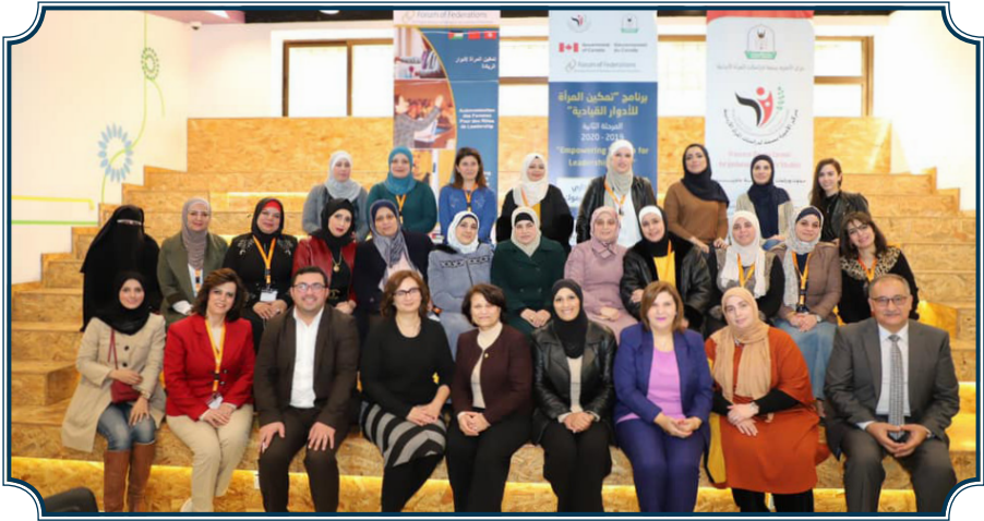
جانب من البرنامج التدريبي ل تمكين الإداريات في جامعة اليرموك من اكتساب المهارات اللازمة للأدوار القيادية- 2019 - المجموعة الثالثة

ومن ضمن فعاليات البرنامج فقد تم استضافة قيادات متميزات، حيث تم استضافة سعادة القاضي إحسان بركات مديرة المعهد القضائي الأردني (حينها) للحديث عن القيادة بالتأثير. وقد حضر اللقاء جميع المشاركات بالبرنامج التدريبي وعدد من أعضاء الهيئة التدريسية بالجامعة، حيث دار حوار موسع أجابت من خلاله سعادة القاضي بركات على أسئلة واستفسار الحضور.