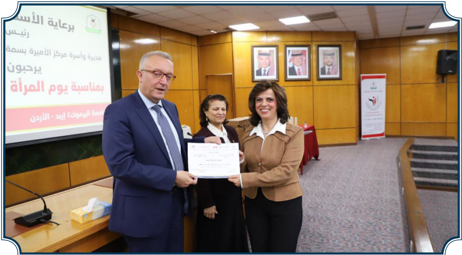
جانب من احتفال المركز باليوم العالمي للمرأة 2022 وتخرج الدفعة الثالثة من البرنامج التدريبي لتمكين المرأة لأدوار القيادة

وفي احتفال المركز باليوم العالمي للمرأة 2022، تم تخريج الدفعة الثالثة والأخيرة برعاية عطوفة الأستاذ الدكتور رئيس جامعة اليرموك بتاريخ 2022/3/8.