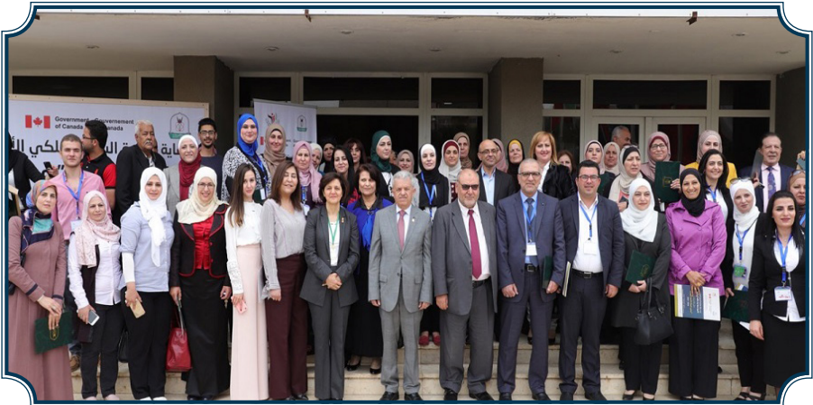
من حفل اختتام السنة الأولى لمشروع تمكين المرأة لأدوار القيادة 2019-4-15