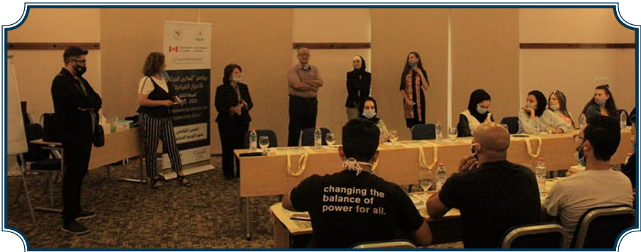
جانب من تدريب طلبة الدراما في مدينة العقبة استمر لمدة أربعة أيام 2020/10/4

وفي شهر تشرين أول 2020 ونظراً للاستجابة للحد من تداعيات جائحة كورونا، والالتزام بالتباعد الجسدي، عقد المركز برنامج تدريبي في مدينة العقبة- الأقل انتشارا للفيروس- لفريق المسرح التفاعلي والذي يضم 15 طالبا وطالبة من فريق الدراما المعني بتنفيذ محور التوعية المجتمعية. حيث تلقى الطلبة المشاركون تدريباً متقدماً على كيفية تطوير العروض التفاعلية إلى عروض رقمية مصورة يعاد عرضها على وسائط التفاعل الاجتماعي الإلكترونية، من خلال تحسين مهارات الصوت والتعبير، والتعبير الجسدي والتمثيل أمام الكاميرا، لجذب التفاعل مع الجمهور الافتراضي، وقد تم بثها عبر صفحة المركز الرسمية ومواقع التواصل الاجتماعي لتحظى بنسب مشاهدة عالية وتعليقات تفاعلية على موقع الفيسبوك.