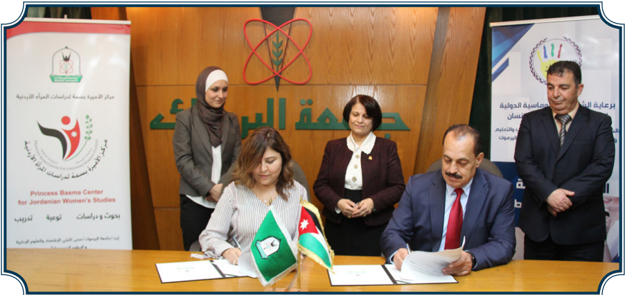
توقيع اتفاقية الشراكة مع منتدى اتحاد الفدراليات وتمويل من الحكومة الكندية. 2018-3-19