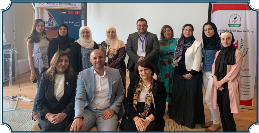
جانب من برنامج تدريب المدربين على مفاهيم «الحكمة الشاملة وتعزيز المنظور الجنساني»

تم تنفيذ البرنامج التدريبي أثناء العمل بواقع 10 أيام تدريبية (يوم/الأسبوع) على 3 مجموعات تضمنت كل مجموعة 20 مشاركة، وقد تميزت الأيام التدريبية بتفاعل مميز من قبل المشاركات على مدار عقد البرنامج التدريبي.