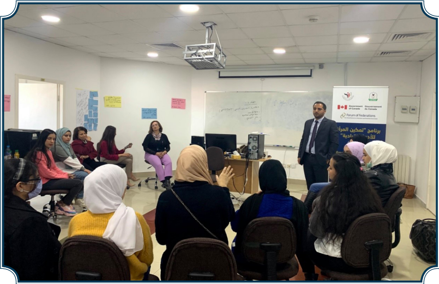
جانب من اختتام البرنامج التدريبي - اعداد التقارير الإعلامية - آذار - 2021