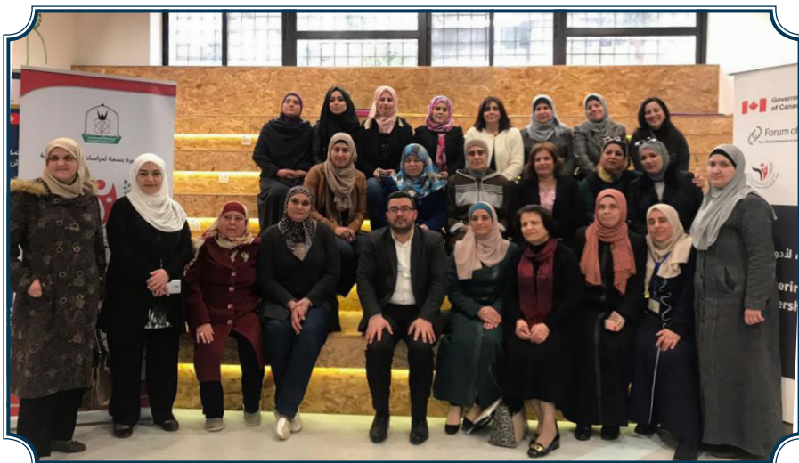
جانب من البرنامج التدريبي لتمكين الإداريات في جامعة اليرموك من اكتساب المهارات اللازمة للأدوار القيادية - 2019 - المجموعة الأولى