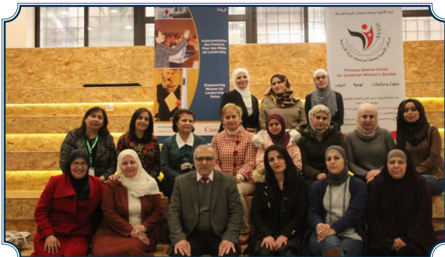
جانب من البرنامج التدريبي لتمكين الإداريات في جامعة اليرموك من اكتساب المهارات اللازمة للأدوار القيادية - 2019 - المجموعة الثانية