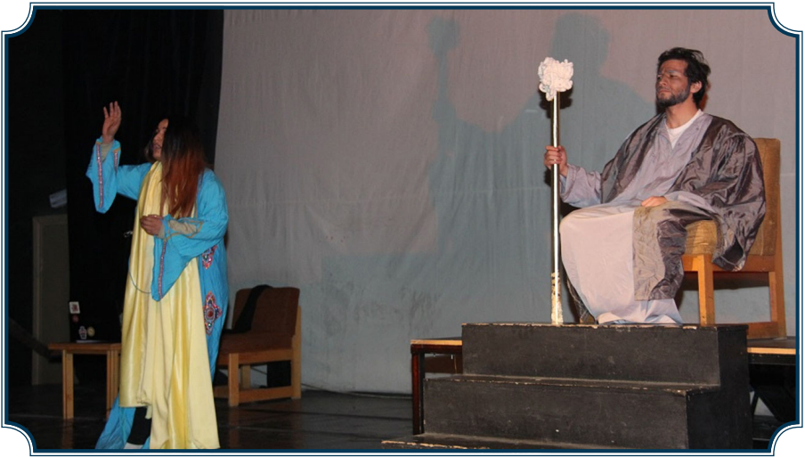
جانب من عرض مسرحية مشاركة بفعاليات مسابقة العروض المسرحية 2019/3/11

كما تضمنت فعاليات هذه المبادرة إطلاق مسابقة فنية للعروض المسرحية لطلبة كلية الفنون الجميلة في العام 2019، حيث تم تدريب 20 طالبا وطالبة من قسم الدراما في كلية الفنون الجميلة على مفاهيم النوع الاجتماعي والمهارات الأدائية للمسرح، من قبل نخبة من أساتذة الدراما في كلية الفنون بالجامعة وإدارة المركز (أ.د. غسان حداد، أ.د. مخلد الزيود، د. آمنة خصاونة)، وتدريب آخر بالتعاون مع المركز الوطني للثقافة والفنون، على مهارات فنون المسرح التفاعلي. ونتيجة لها تم تقديم عروض دراما تفاعلية لاقت قبولا وتأييدا من جمهور المشاهدين للمضامين المحتواة في العروض. حيث تم إنتاج أربعة عروض مسرحية (البندل - مشروع -21 ابرة وخيط - المحكمة) متضمنة لمفاهيم النوع الاجتماعي وأهمية دعم وتمكين المرأة.