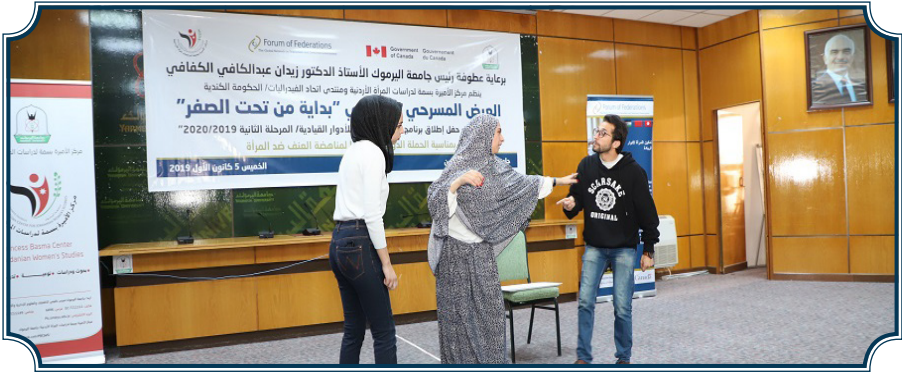
عرض مسرحي تفاعلي بعنوان «بداية من تحت الصفر» 2019/12/15

وفي شهر تشرين أول 2020 ونظراً للاستجابة للحد من تداعيات جائحة كورونا، والالتزام بالتباعد الجسدي، عقد المركز برنامج تدريبي في مدينة العقبة- الأقل انتشارا للفيروس- لفريق المسرح التفاعلي والذي يضم 15 طالبا وطالبة من فريق الدراما المعني بتنفيذ محور التوعية المجتمعية. حيث تلقى الطلبة المشاركون تدريباً متقدماً على كيفية تطوير العروض التفاعلية إلى عروض رقمية مصورة يعاد عرضها على وسائط التفاعل الاجتماعي الإلكترونية، من خلال تحسين مهارات الصوت والتعبير، والتعبير الجسدي والتمثيل أمام الكاميرا، لجذب التفاعل مع الجمهور الافتراضي، وقد تم بثها عبر صفحة المركز الرسمية ومواقع التواصل الاجتماعي لتحظى بنسب مشاهدة عالية وتعليقات تفاعلية على موقع الفيسبوك.