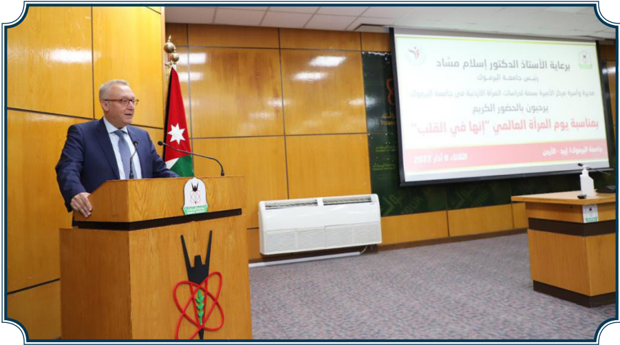
جانب من احتفال المركز باليوم العالمي للمرأة 2022 وتخرج الدفعة الثالثة من البرنامج التدريبي لتمكين المرأة لأدوار القيادة